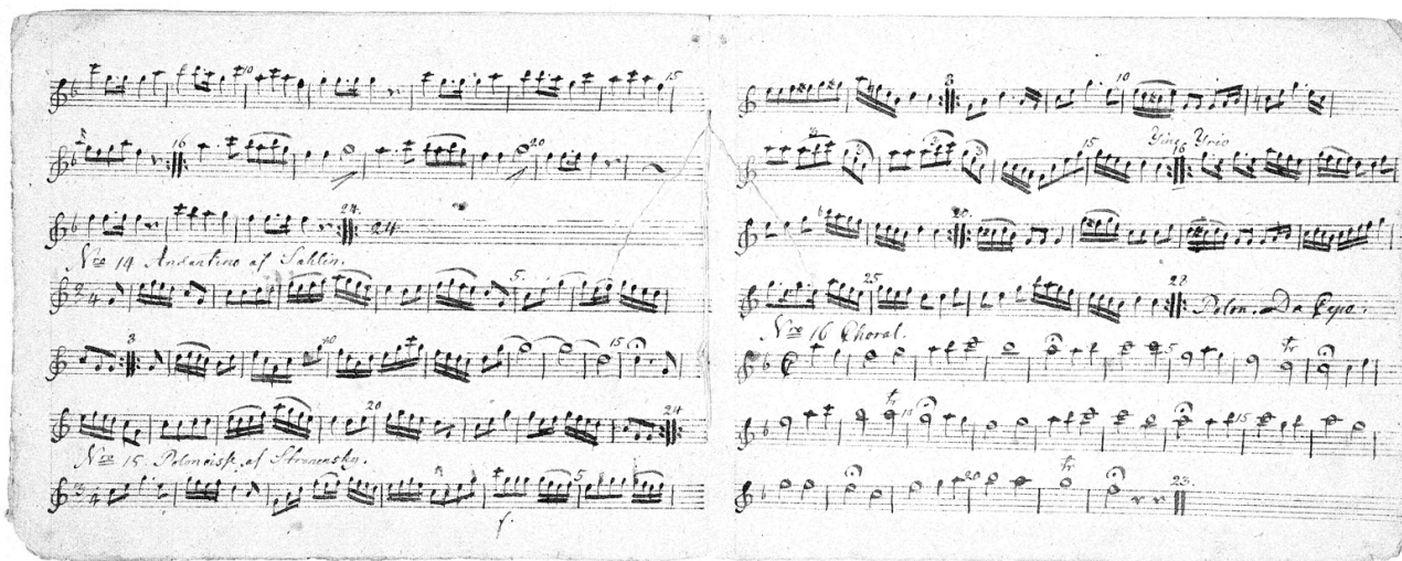
Figure 1 N. 15, Polonaise pour clarinette de Johann Ignaz Stranensky (Kungl. Biblioteket, Stockholm, FfB-R).