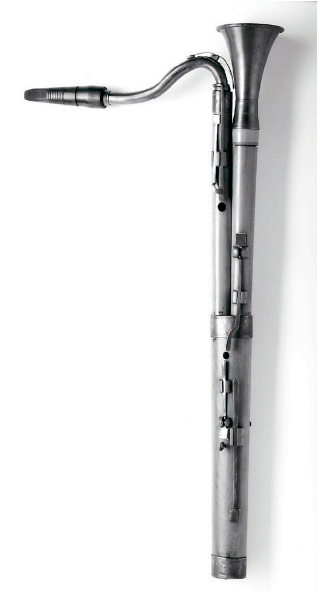
Figure 6 Greaser, clarinette basse en Sib à 9 clefs (Hessisches Landesmuseum, Darmstadt, Kg 67:133), vu frontale et de dos.