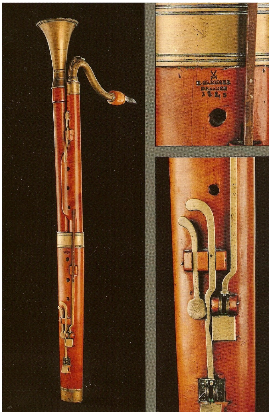
Figure 5 Heinrich Grenser, clarinette basse en Sib à 8 clefs (Musikmuseet, Stockholm, M2653).