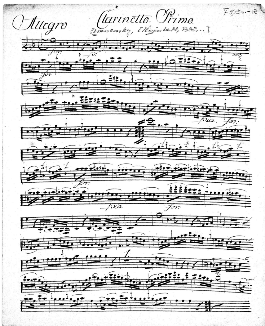
Figure 2 Part de la première clarinette de la Quintette pour deux clarinettes en Sib, deux cors en Mib et basson de Stranensky (Kungl. Biblioteket, Stockholm, F.5/sv.-R).